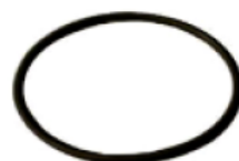
4600605 : FKM O-RING,