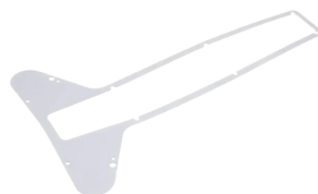
4604211 GASKET, ARM COVER