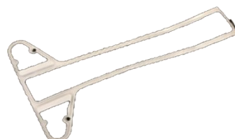
4604548 GASKET/SEAL HYBRID – ARM COVER