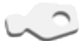
4611334 CB BOLT STOP