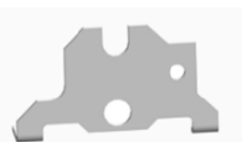
4606137 Actuator Canopy Holder