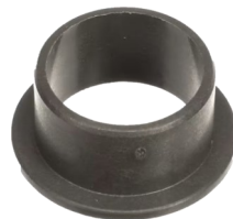
4600863 HIGH-LOAD OIL- EMBEDDED SLEEVE BEARING