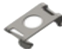
461132 ARM SPACER