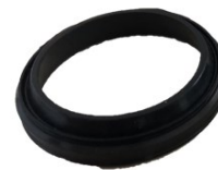
4610081 SHAFT SEAL black