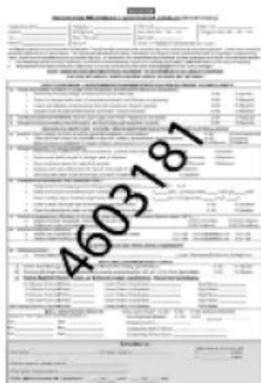
4603181 PREVENTIVE MAINTENANCE/ CERTIFICATION CHECKLIST